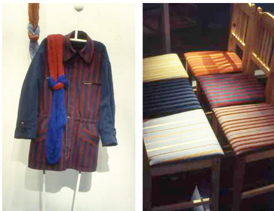
Kuva 10. Folklore-kokoelman takki ja verhoilukankaita.