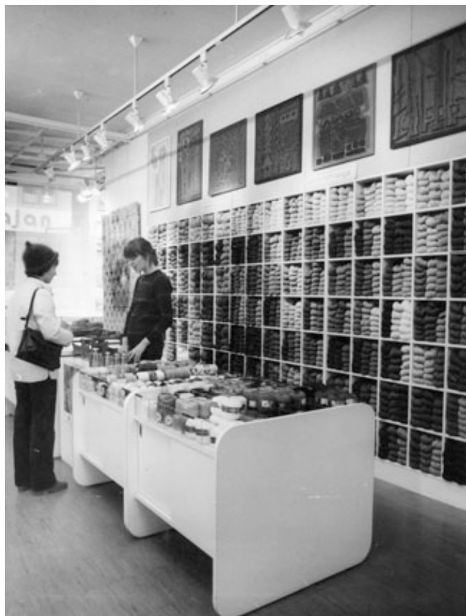
Kuva 2. Lankaostoksilla Wetterhoffin myymälässä.

Muiden tilajärjestelyjen yhteydessä pantiin vireille myymälän korjaus-, muutos- ja uusimistyö. Myymälä laajeni kesäkuun 1976 alusta ammattikutomon tiloihin, kun ammattikutomo siirtyi II kerroksen tiloihin. Marraskuussa 1976 avattiin lankapuoti.