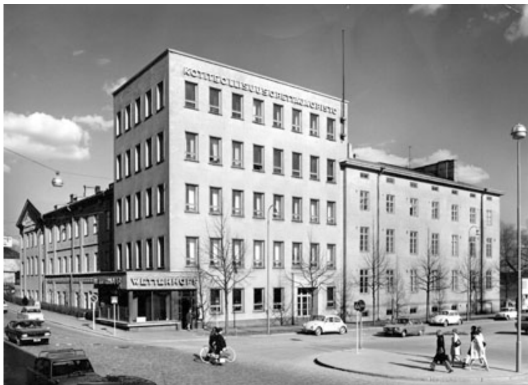
Kuva 1. Wetterhoffin kotiteollisuusopettajaopiston rakennukset kadun puolelta vuonna 1975.

TOINEN OSA: WETTERHOFFILAISEN TUOTESUUNNITTELUN VAIHEITA 1970-LUVULTA 2000-LUVULLE