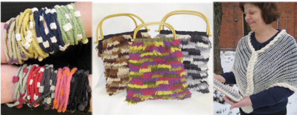
Kuva 15. "Langoilla leikiten" – ideakilpailussa vuonna 2008 menestyneitä tuotteita

Nykyään Wetterhoff Oy:n ohjelmana on ottaa joka vuosi valikoimaan vähintään neljä uutta mallia, joista yksi on ryijymalli, yksi neulemalli, yksi kutojille tarkoitettu sekä yksi Wetterhoffin tekstiilikokoelmista nykymateriaaleille sovitettu malli. Uusissa tuotteissa on viime aikoina ollut linjauksena vanhojen käsityötekniikoiden tuominen esille: tätä linjausta edustavat mm. haarukkapitsi- ja neuleharppukeepit, virkattu lapanen ja putkineulesukka. Uusia suunnittelijanimiä ja uudenlaisia tuoteideoita on noussut esille kilpailujen tuloksena. Fredrika Wetterhoff –säätion vuonna 2008 järjestämässä "Langoilla leikiten" – ideakilpailussa menestyivät mm. ryijytekniikalla toteutetun "Hipsun hapsun" -laukun ideoinut Sisko Sälpäkivi, neuleharppukeepin suunnitellut Marjo Pylväs ja virkatut "Kiedottavaksi" -korut suunnitellut Leena Miettinen.