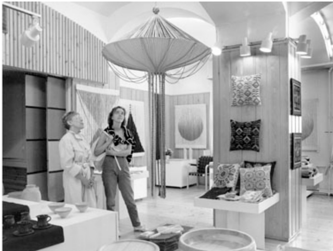
Kuva 9. Näkymä Wetterhoffin myymälästä vuonna 1988.

Säätiön toiminnan ”näyteikkuna” oli myymälä, jossa myytiin lähinnä oman ammattikutomon tuotteita. Myymälä oli myös suosittu turisti- ja vierailukohde, jota tultiin bussilasteittain kauempaakin katsomaan.