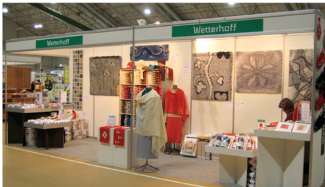
Kuva 16. Wetterhoff Oy:n osasto Seinäjoen Käsityömessuilla vuonna 2008.

Wetterhoff Oy:n tuotteiden pääasialliset myyntikanavat ovat verkkokauppa ja oma myymälä. Yhtiön omia tuotteita – lankoja ja tarvikepaketteja – markkinoidaan valtakunnallisesti verkkokaupan, messujen sekä alan lehtien (Taito, Loimien lomassa) kanssa tehtävän yhteistyön kautta. Myymälän markkina-alue on paikallinen, se kattaa Hämeenlinnan ja ympäristökunnat, ja sen asiakaskunnan muodostavat käsityöharrastajat, lahjanostajat ja matkailijat. Messuihin osallistutaan syksyisin: vakituisesti Tampereella Suomen kädentaidot –tapahtumaan sekä vaihdellen eri paikkakunnilla 2-3 muihin messuihin. Messuosastolla on aina oltava esillä joitain uusia tuotteita.