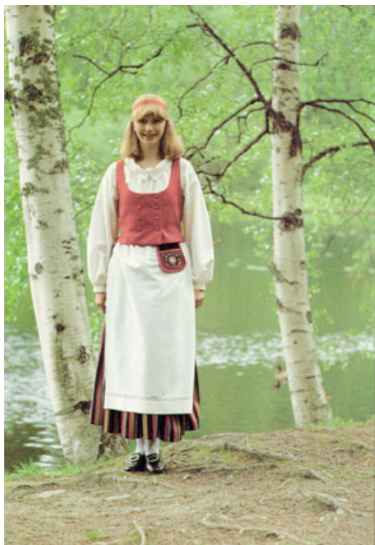
Kuva 4. Tuuloksen puku Wetterhoffin kansallispukuvalikoimasta.

Fredrika Wetterhoff -säätio alkoi 1970-luvun lopussa jälleen tuottaa myyntiin kansallispukuja ja niiden tarvikkeita. Kansallispukuja oli aikoinaan alettu valmistaa Fredrika Wetterhoffin Työkoulussa pian sen perustamisen jälkeen, joten nyt palattiin jatkamaan vanhaa perinnettä. Pukujen valmistuksessa noudatettiin Suomen kansallispukuneuvoston hyväksymiä ohjeita ja periaatteita, joihin kuuluu alkuperäisten kansanpukujen perinteisten työtapojen sekä pukujen yleisilmeen huomioonottaminen. Pukujen kankaat kudottiin Wetterhoffin kutomossa. Rinnan pukujen kehittelyn kanssa tutkittiin materiaaleja ja työmenetelmiä. Tuloksena oli muun muassa ns. kansallispukulanka, joka vastaa alkuperäisissä kansallispuvuissa käytettyä karstalankaa. Lankojen värit saatiin Museoviraston vanhoista puvuista. Wetterhoffilla kehiteltiin myös karjalaisiin pukuihin sopiva poimutettu ja vanutettu hamekangas sekä vanutettu liivikangas. Wetterhoffilla tuotantoon otetuista puvuista alettiin rohkeasti tehdä pitkiä. Aluksi tämä herätti epäilyksiä, mutta kun ensimmäiset pitkät puvut olivat esillä messuilla Helsingissä 1982, oli vastaanotto hyvin innostunut – oltiin sitä mieltä, että nyt kansallispuku näyttää todella juhlapuvulta.